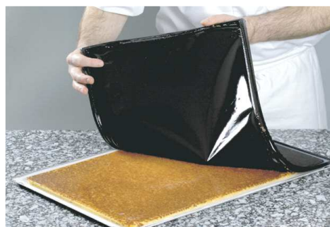
Crujiente de avellanas