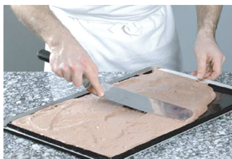
Biscuit de chocolate