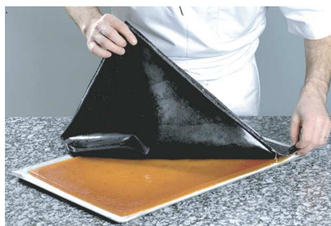
Puré de Frutas